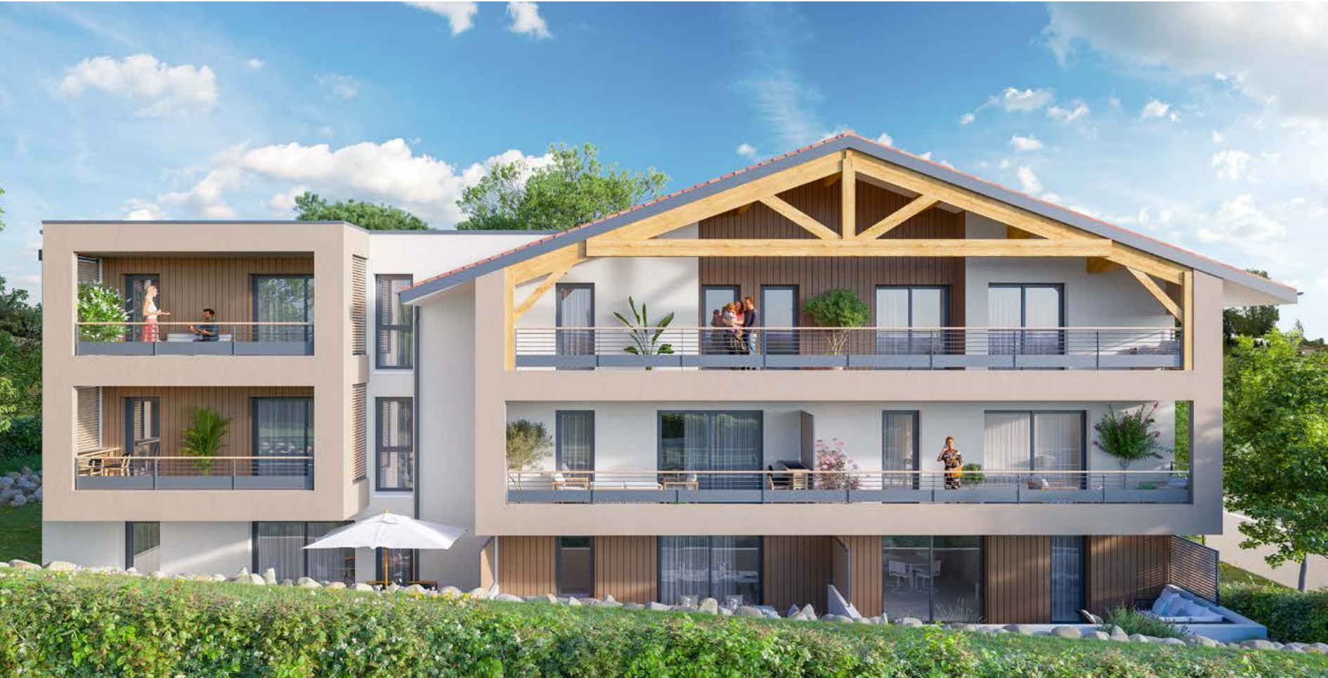
FAÇADE CÔTÉ RUE